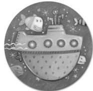
Le Sous-marin Super

Note: Quelques des Disques de Surprise illustrent le même cadeau sur les deux côtés.