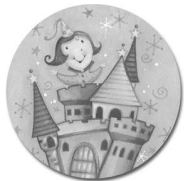
Le Palais de Soirée