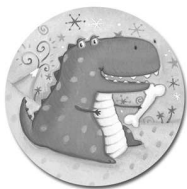
Le Dinosaur Fringant

Il y a quatre sortes de cadeaux qui sont illustrés sur les Disques de Surprise: