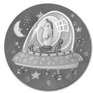
Le Vaisseau Spatial Rapide