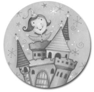
Palacio de Fiesta